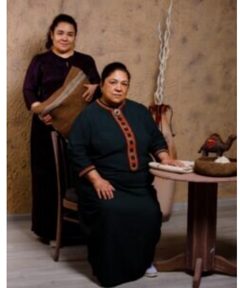
Mutter und Tochter bringen gemeinsam ihr Unternehmen voran.

'Partnering in Business with Germany' is an instrument to promote foreign trade and investment by the