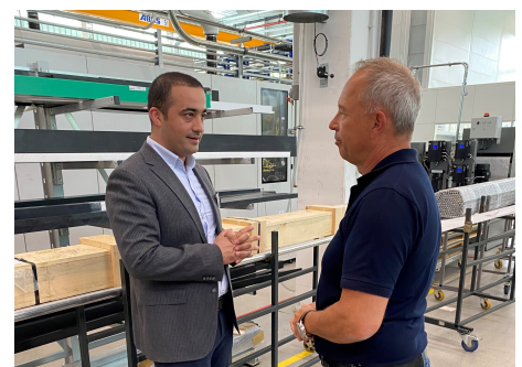
Informationen zum Automationsverfahren gab der Produktionsleiter (rechts) der Schmalz GmbH

Als Familienunternehmen in dritter Generation verfolgt das Unternehmen kontinuierlich eine nachhaltige Zielsetzung und handelt danach sowohl mit der neuen Produktentwicklung für Energiespeicher als auch mit eigenem Kraftwerk. Schmalz will in seinem Hauptsitz Glatten mehr Energie mit eigenen Anlagen regenerativ erzeugen als vom Unternehmen verbraucht