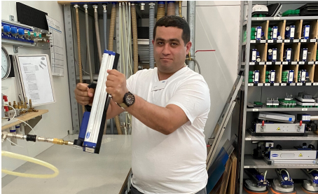
Im Testlabor der Schmalz GmbH