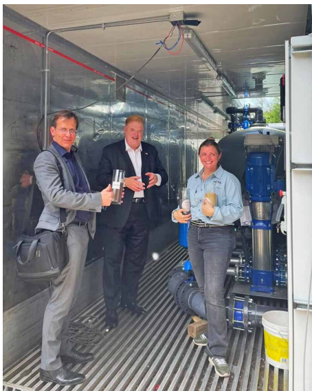
Besuch bei der Firma VOENS