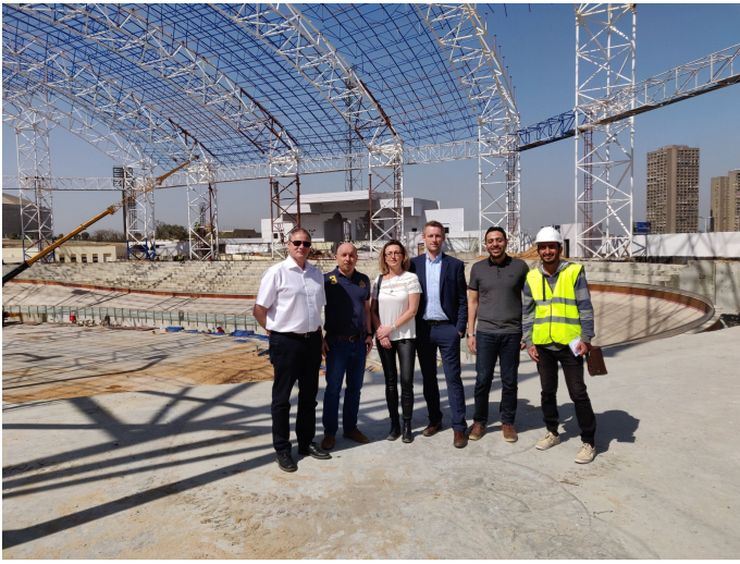
Vertreterin und Vertreter des Unternehmens Loesche GmbH vor Ort in Ägypten

Unternehmen in Afrika. Für die Loesche GmbH haben wir Stahlkonstruktionen für ein Zementwerk in Ruanda produziert und den Aufbau überwacht. Außerdem haben wir in Kooperation ein Zementwerk in Liberia errichtet.