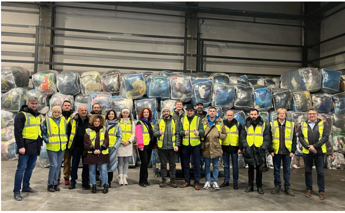
In der Lagerhalle für Altkleider und Altschuhe bei Glaeser

nachhaltigen Prozesse des Unternehmens beeindruckt. Die Gelegenheit sich mit dem Management auszutauschen, half ihm zudem das Gesehene für sich und sein Unternehmen besser einzuordnen. „Diese Gespräche vermitteln wertvolle Einblicke in die Geschäftsstrategie, die Marktpositionierung und die Kundenbetreuung. Ich konnte nützliche Ideen und bewährte Verfahren kennenlernen, von denen ich glaube, dass sie bei K.TEX angepasst und umgesetzt werden können, um unsere Wettbewerbsfähigkeit und Kundenzufriedenheit zu verbessern.“